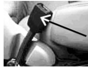
フェルトパッチ貼り付け部 5) 参照